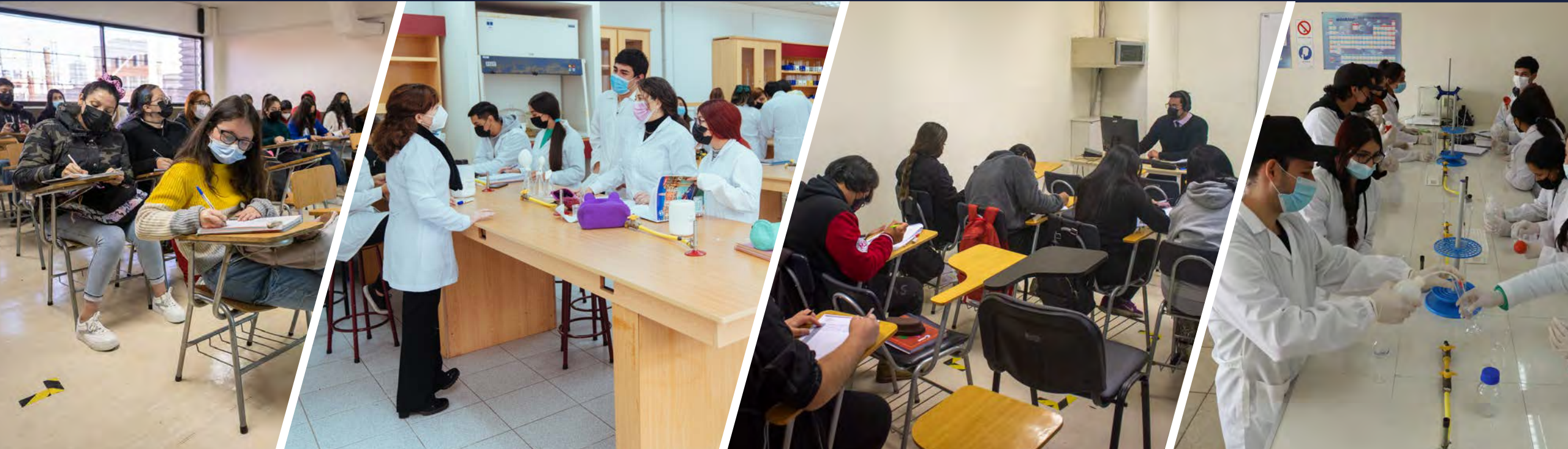
Estudiantes UDALBA Antofagasta