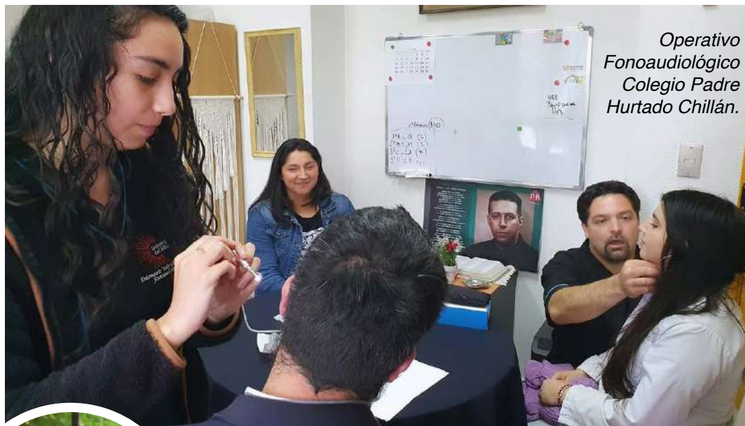
Operativo Fonoaudiológico Colegio Padre Hurtado Chillán.

Además, tiene las competencias suficientes para liderar equipos multidisciplinarios y de investigación cuyo fin es mejorar la calidad de vida de personas con algún trastorno de la comunicación. A esto se suma la importante participación que tuvo este profesional en la atención de pacientes intubados a causa de COVID-19,