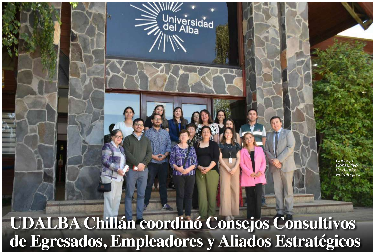
Consejo Consultivo de Aliados Estratégicos

Boletín Informativo VcM y Comunicaciones UDALBA Chillán Año 1 Edición Bimestral N° 3 / Especial Fin de Año 2023 #udalbasevincula